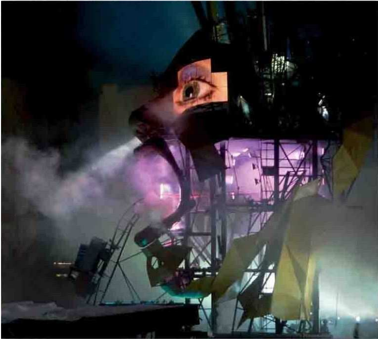
IMAGEN Y COLOR PARA GRANDES ESCENARIOS

Concebidos para formar espectaculares escenografía, la ligereza, facilidad y rapidez de instalación de los paneles luminosos STC permiten incorporar a cualquier escenario colores, texturas e imágenes en movimiento.